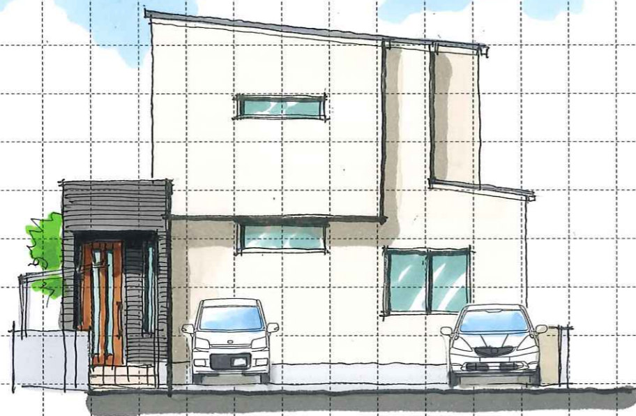
East elevation (東)