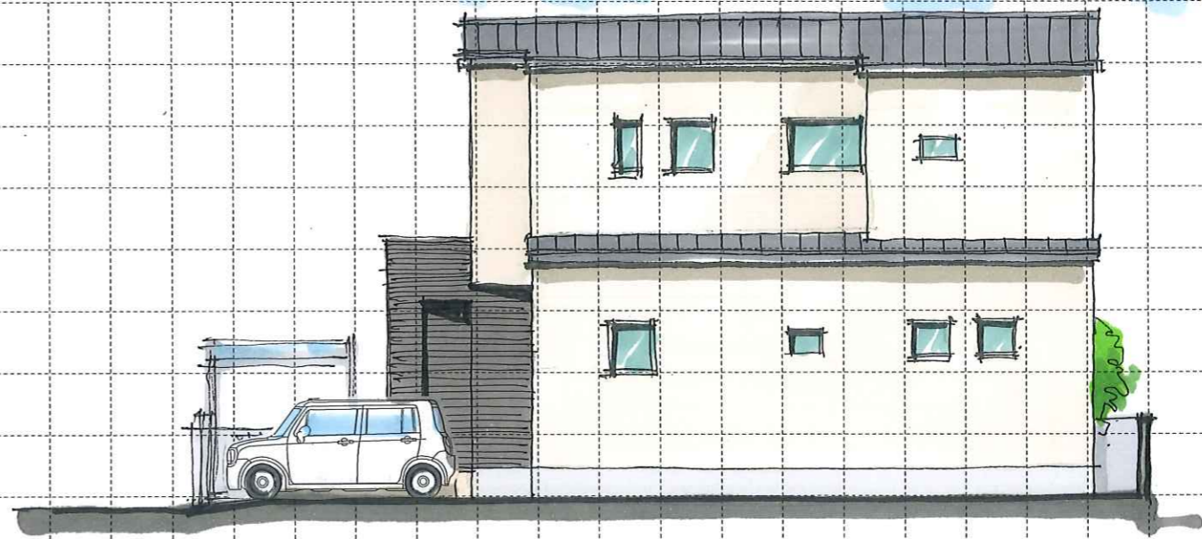
North elevation (北)