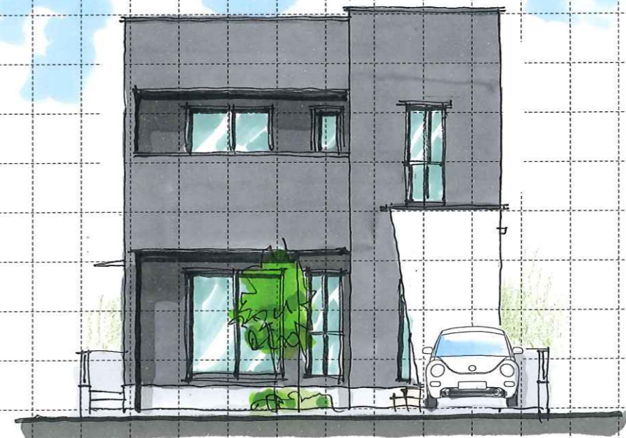
B TYPE South elevation (南)