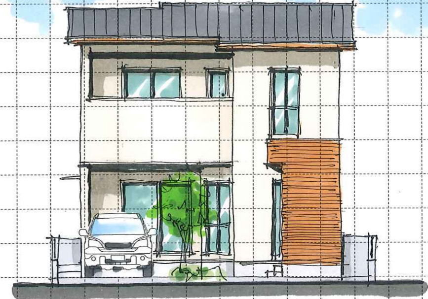
A TYPE South elevation (南)