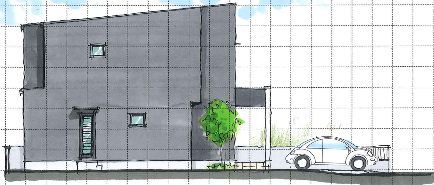
B TYPE West elevation (西)