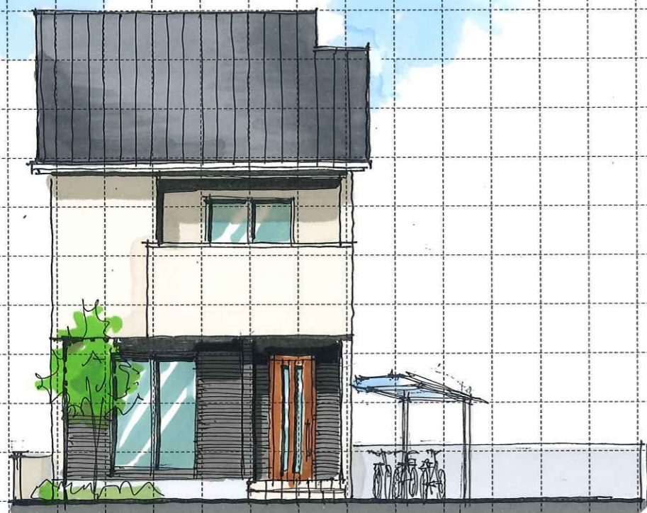
South elevation (南)