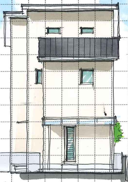
North elevation (北)