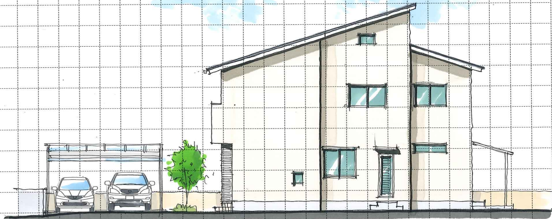
East elevation (東)